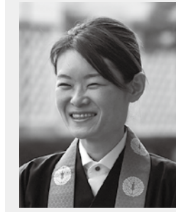
＜略歴＞ 1979年、富山県氷見市生まれ。真宗大谷派教学研究所研究員、同朋大学仏教文化研究所客員所員、大谷大学非常勤講師、龍谷大学非常勤講師。高岡教区第7組安専寺衆徒。真宗大谷派擬講。

このように、語られたものを聞き伝えることでも、仏教は伝灯されてきました。私たちが様々な念仏の教えに出あったことを、各地に巡回されてきた「お太子さま」への信仰を通して気付かされています。